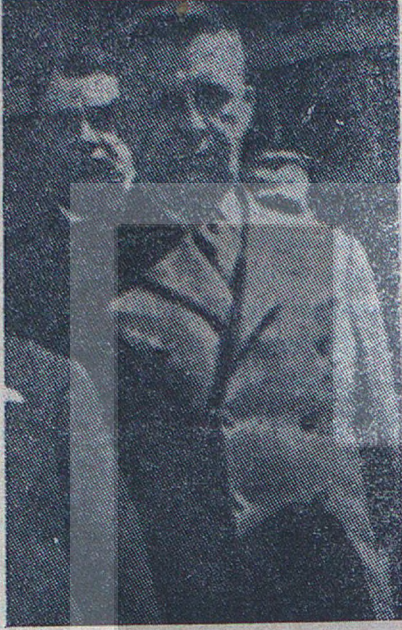
Tekel Bakanı F. Şerafettin Bürge

nelerin emeği nazarı itibara alınmaksızın 9 arkadaşımın birlikte kadro tasarrufu yüzün-